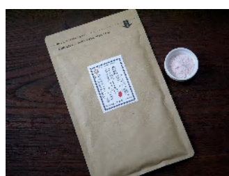
紅麹甘酒パウダ無糖（60g） 540円