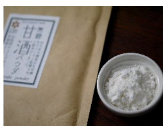
甘酒パウダ無糖（180g） 1,404円