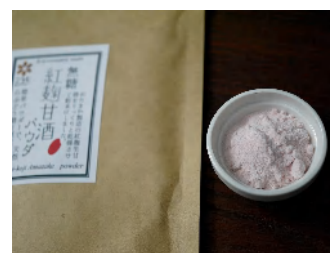
紅麹甘酒パウダ無糖（180g） 1,404円