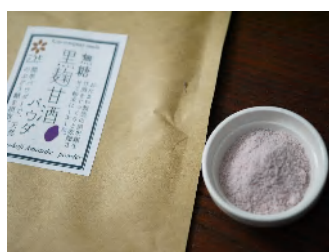
黒麹甘酒パウダ無糖（180g） 1,404円