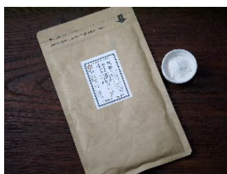
甘酒パウダ無糖（60g） 540円

当店の生甘酒を低温で丁寧に粉末にして出来た無糖甘酒パウダーです。 便利なチャック付き袋 賞味1年（360日）