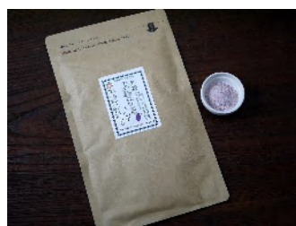
黒麹甘酒パウダ無糖（60g） 540円