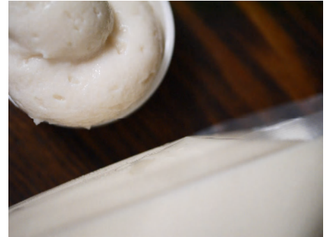
吟醸酒粕生ペースト業務用 (8kg) 6,264円

地元山形の酒蔵の吟醸酒粕を当店の 臼式特殊粉碎機で、ナノレベルまで加工し出来ました。 酒粕内のこうじの粒は全く御座いません!