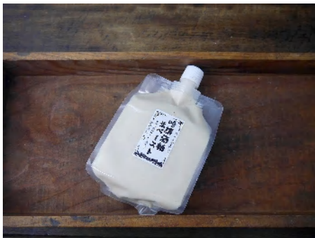
吟醸酒粕生ペースト (600gCB) 756円