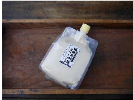
純米大吟醸酒粕生ペースト (600gCB) 918円