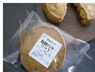
味噌バタークッキー 1個 129円

当店の甘味噌をパウダーにして生地に入れて、良質のバターを使いじっくりと焼き上げました。