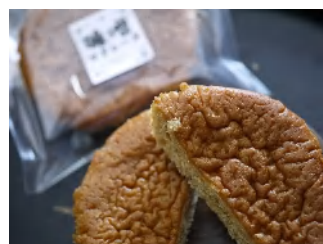
味噌レーヌ 1個 162円

当店の天然醸造浮き麹味噌を粉末にし、生地練り込んでおいしいマドレーヌに仕上げました。