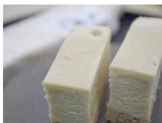
味噌マージュ 1本 162円

当店の天然醸造 赤麹味噌粉末と数種のチーズを練りこみ、ベイクド風に仕上げた棒タイプのチーズケーキです。