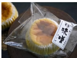
完熟味噌チーズケーキ 1個 140円

日本古来の伝統食、味噌・酒粕・甘酒などの発酵食品をパウダーにして生地に入れた。体にやさしいお菓子♪