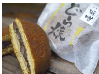
味噌バターどら焼き 1個 172円