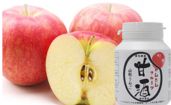
山形りんご Yamagata Apple