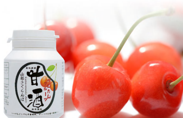
山形さくらんぼ Yamagata Cherry