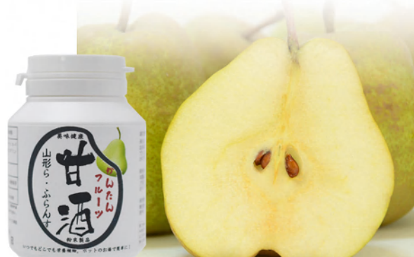
山形ラ・フランス Yamagata La France