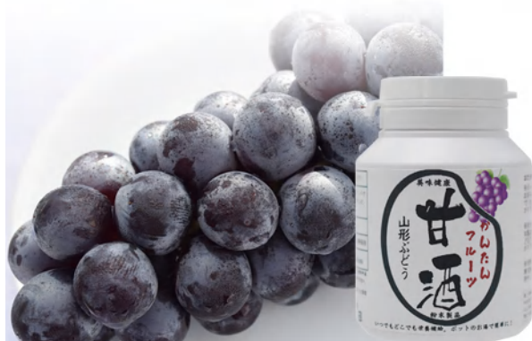
山形ぶどう Yamagata Grape